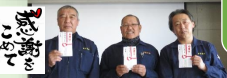
永年勤続表彰 30年、20年、10年

事故の加害者にも、被害者にもならないようにして欲しい。交通事故は人災です。減らしましょう。無くしましょう。