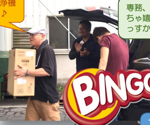
専務、空気清浄機めっちゃ嬉しそうじゃないっすかあ～(笑)