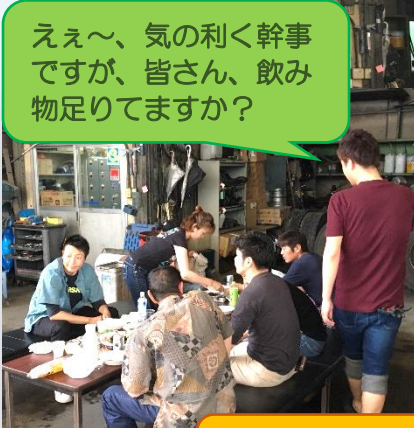
ええ～、気の利く幹事ですが、皆さん、飲み物足りてますか？