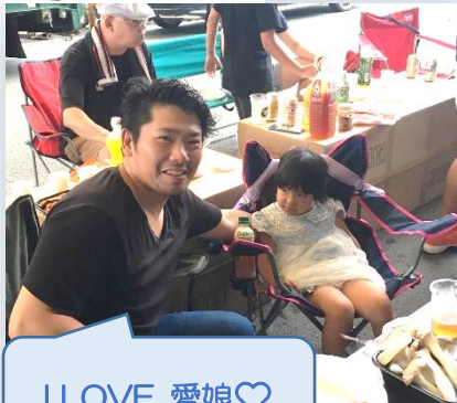
I LOVE 愛娘♡

毎年恒例になってきた社屋での BBQ 大会！ 昨年は 8 月下旬に猛暑の中開催し大変だったので、今年は早々 6 月に開催しました～！ 子供たちも参加し、用意してもらったお肉や野菜、海鮮やおにぎりをたらふく頂いた後はお約束の BINGO 大会♪ 毎回準備や買い出しに走ってくれるのは 20 代の社員さん。フットワークがいいったらありゃしない(≧▽≦) お陰でみんな楽しい時間を過ごせました!! いつも本当にありがとお!!