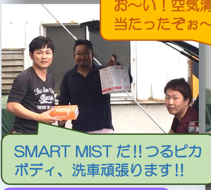
お～い！空気清浄機当たったぞお～♪