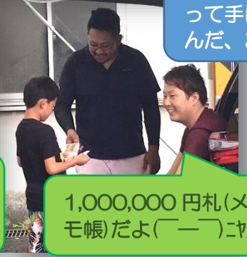
1,000,000 円札(×モ帳)だよ(ー)ニハ