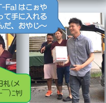
T-Fal はこおやって手に入れるんだ、おやじ～