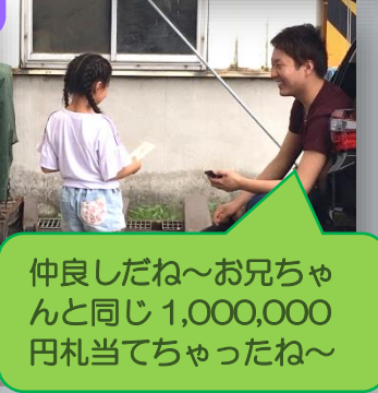
仲良しだね～お兄ちゃんと同じ 1,000,000 円札当てちゃったね～