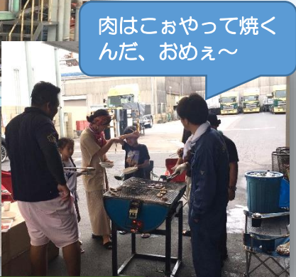
肉はこおやって焼くんだ、おめえ～