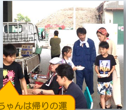
兄ちゃんは帰りの運転手だから呑んじゃダメだからねっ!!